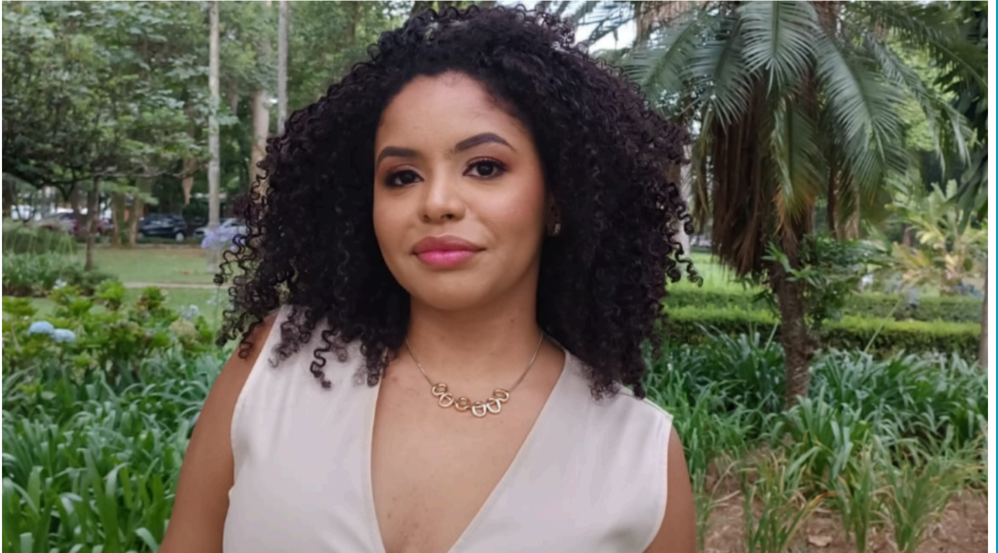
Estudante da FSP-USP ganha prêmio Carolina Bori Ciência & Mulher