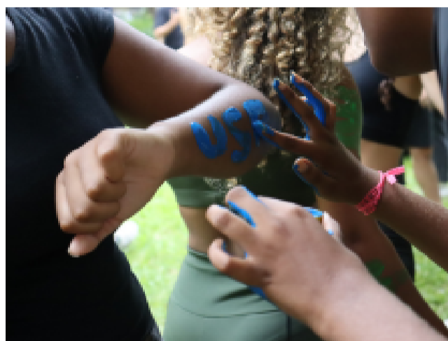
FSP-USP celebra a chegada dos novos alunos na Semana de Recepção