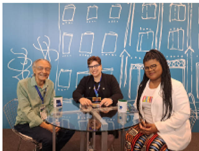
Revista de Saúde Pública lança episódio especial gravado durante o 14º Abrascão