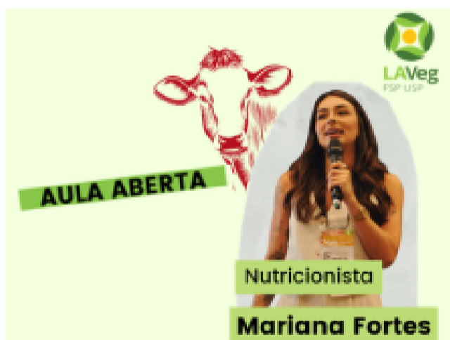
Aula Aberta sobre “Dieta Carnívora: Os Perigos das Dietas da Moda”, no dia 3 de março